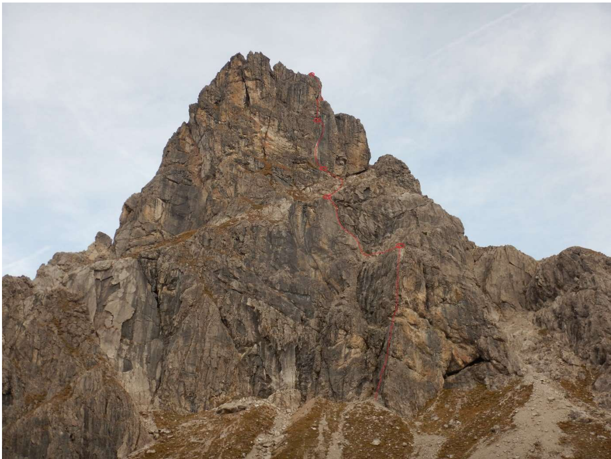
Balschturm Südostwand Übersichtsbild

Vom Gipfel nach Norden in die Scharte zur Baltschespitze, aus dieser durch eine Rinne nach rechts (Ost) absteigen.